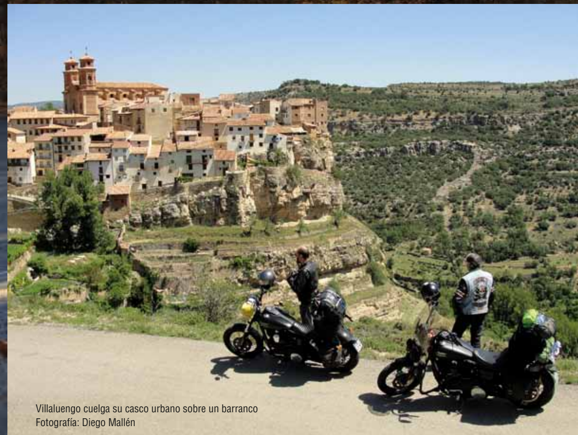
Villaluengo cuelga su casco urbano sobre un barranco

En torno al kilómetro 17,3, el punto más elevado antes de iniciar la bajada hacia los Órganos de Montoro, otro mirador permite contemplar el “skyline” del Alto Maestrazgo en todo su esplendor. Un gigantesco retablo de montes, colinas, nubes, bosques y masadas.